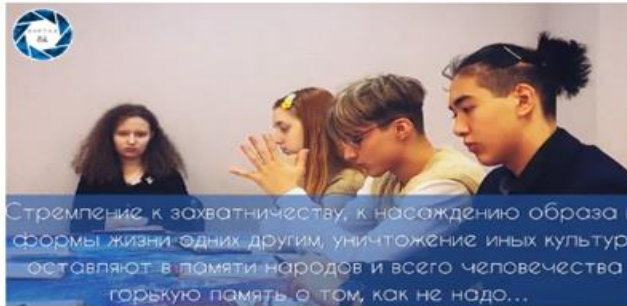
БРАТСТВО СТОЛА. Третий повод поговорить: Послание в будущее: по приколу?