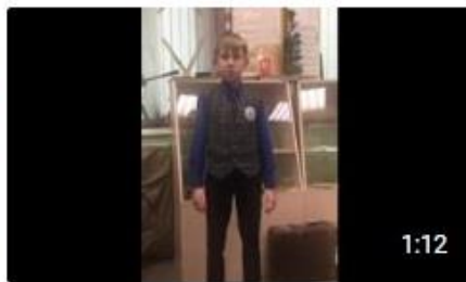
«Ленинградский салют» Ольга Берггол... Портал84