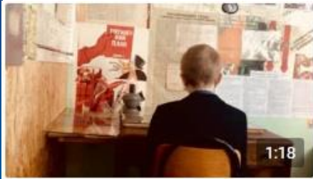
Письмо эвакуированному из Ленингра... Портал84 45 просмотров · пять месяцев назад