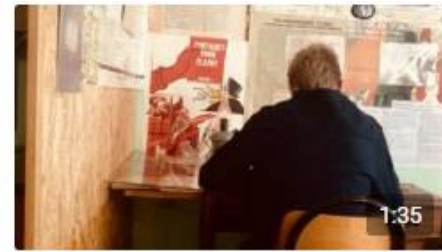
Два грустных письма эвакуированным... Портал84 40 просмотров · пять месяцев назад