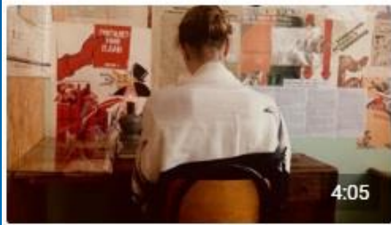
Письмо из блокадного Ленинграда эва... Портал84