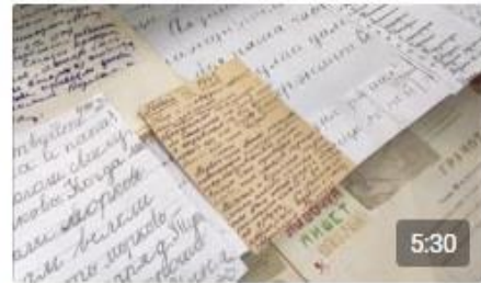
Без названия РДШ Петроградского района 213 просмотров · минуту назад