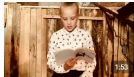
Дорога в школу Портал84 36 просмотров · четыре месяца назад