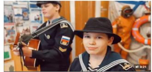
Малочиски из 6 «а» поздравляют с 8 марта 861 просмотр