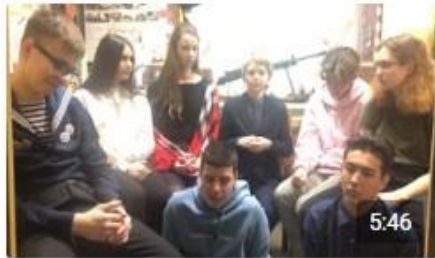
Анонс аудио-спектакля «Высшая мера» Портал84 271 просмотр · минуту назад