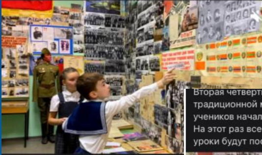
Метапредметная неделя в начальной школе 271 просмотр

А если представить, что вы пробежались по четвёртому этажу, заглядывая одним глазком в каждый из классов, вот, что бы вы увидели!