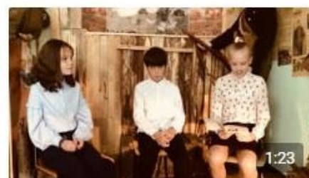
бодрое письмо эвакуированным деть... Портал84