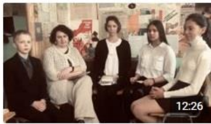
Рассказ об эвакуированных из Ленинг... Портал84