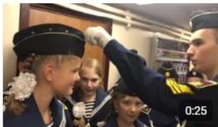
За пять минут до начала открытия цер... Портал84 568 просмотров · четыре месяца назад