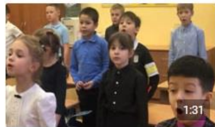
Мальчишки у стен Ленинграда Портал84