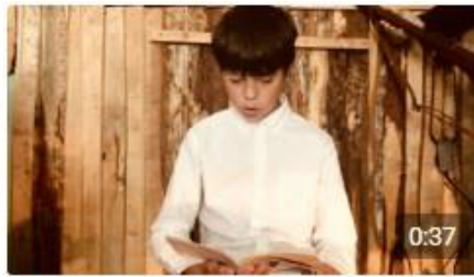
Письмо от мальчика из эвакуации сво... Портал84 44 просмотра · пять месяцев назад