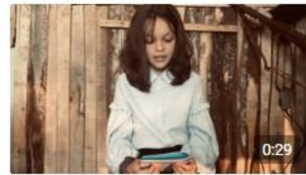
детям блокады Портал84