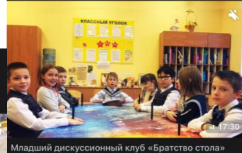
Младший дискуссионный клуб «Братство стола»

Пока Метапредметная неделя в начальной школе идёт полным ходом - вы участвуете в специальных уроках, учитесь продумывать и готовить экспозицию своего музейного уголка в классе, готовите экскурсии по своему филиалу школьного музея, - мы провели тематический дискуссионный клуб! Внимания просим!