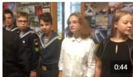
морские кадеты перед подготовкой к ... Портал84 93 просмотра · четыре месяца назад