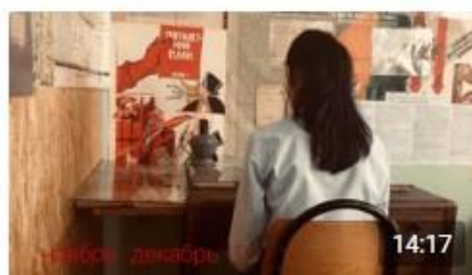
Путь ленинградских детей в эвакуацию Портал84